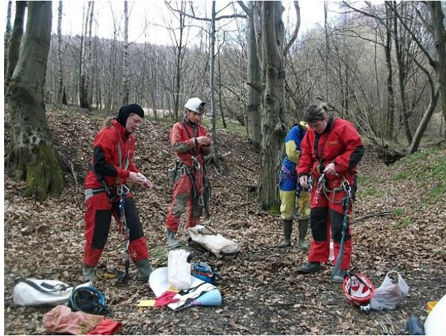
Királylányosba öltöztek a lányok ☺