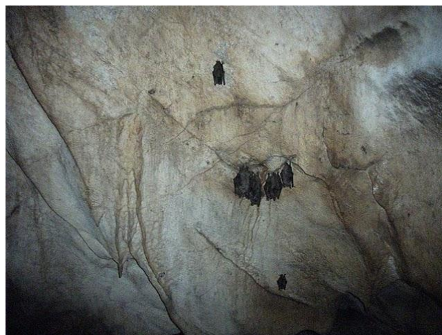
A hőbörgő bőrdögök