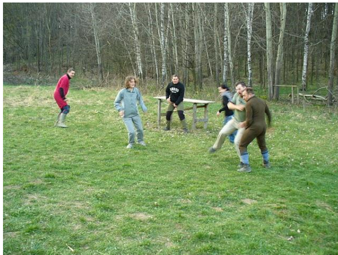
Komoly test-test elleni harc pirosban meg a csodacsatár várja a labdát