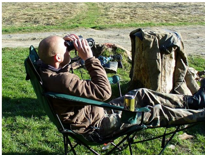
A munka hőse

Iszonyat megalázó 6:1 győzelmet aratunk Zsé és csapata ellen. Nem volt ellenfél a pályán. Bár Pinti félidőben való leszerződése miatt picit megijedtünk, de inkább az erdő mélyén keresgélő rókákra voltak veszélyesek a lövései, mint a kapura. ☺ Az első esti túlvállalása után Caca folytatta a tűzmesteri feladatot.