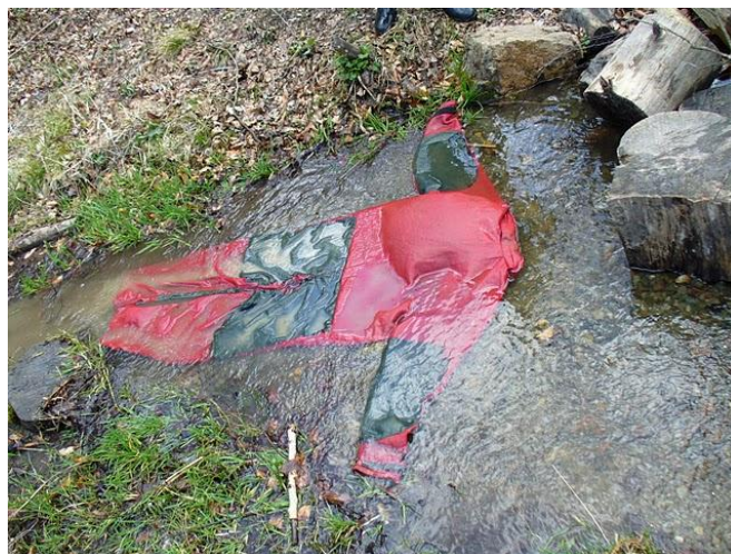
Vizi hullá lettem a felszínen lebegő

Mi nyertünk a kijövetelben, bár utólag belegondolva lehet, hogy a többiek direkt erre játszottak, mert ezzel miénk lett a megtisztelő szerep, hogy az előző napon összesarazott köteleket a patakban kimoshassuk.