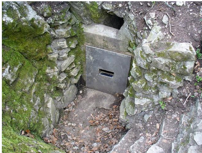
Ez is egy bejárat a Létrásihoz. Mi itt jöttünk ki